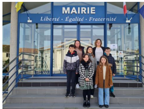
Commission Loisirs et Nature