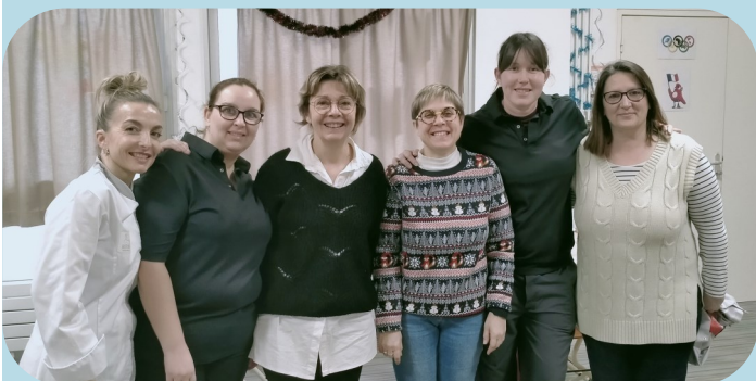
L'équipe de la Pause méridienne de l'école du Moulin

Sur ce temps ce sont 110 enfants accueillis pour l'école du Moulin, et 120 pour l'école Notre Dame. L'équipe qui intervient sont des agents communaux et des agents de l'entreprise de restauration Restoria.