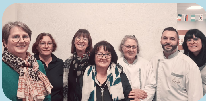
L'équipe de la Pause méridienne de l'école Notre Dame