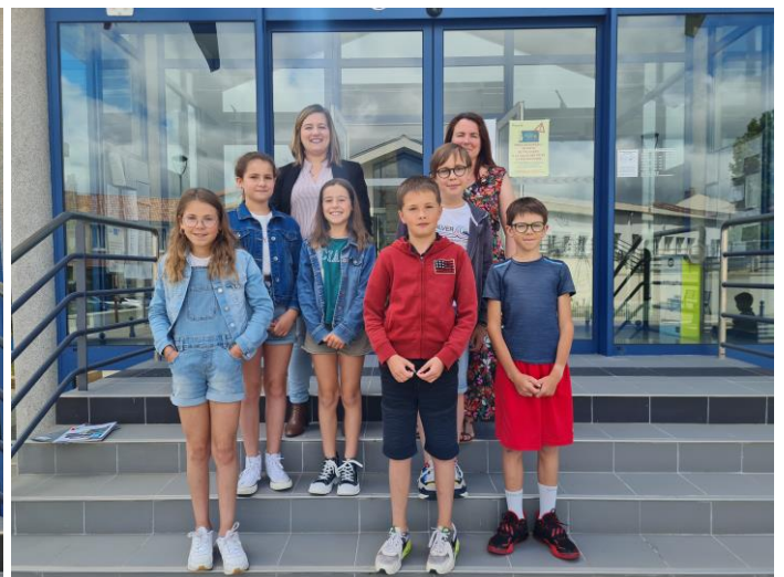
Commission Loisirs et Nature