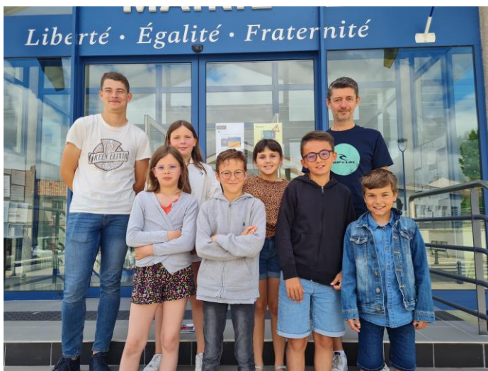
Commission Animation et Social

En fin de séance, les photos de commissions ont été réalisées